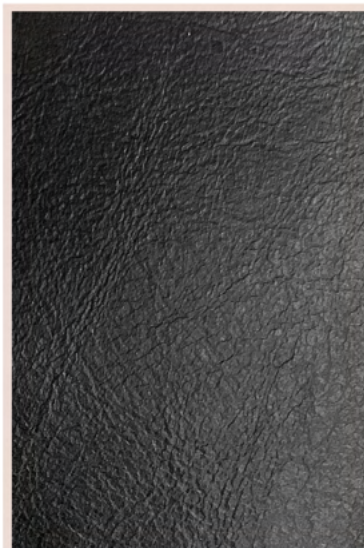
Pueblo K Cor: 30456 Espessura: 08/10