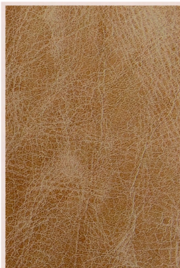
Cor: 20363 Espessura: 08/10