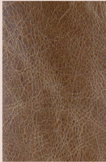
Cor: 20407 Espessura: 08/10