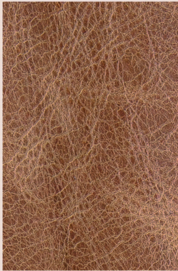
Cor: 20362 Espessura: 08/10